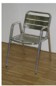
Bistrostuhl mit Armlehne