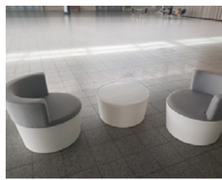
Set: Lounge Conic