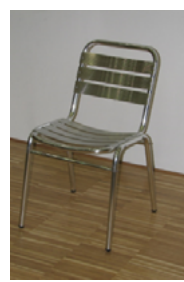
Bistrostuhl ohne Armlehne