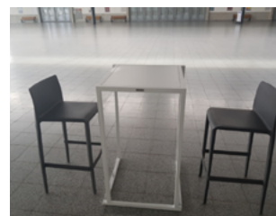
Set: Kubo Fero & Pedralli