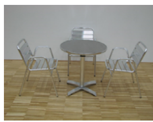
Set: Bistro, Aluminium