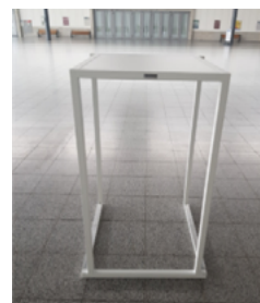
Stehtisch: Kubro Fero